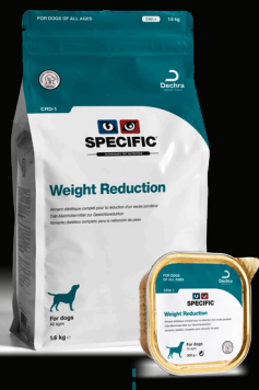
SPECIFIC™ Weight Reduction CRD-1/CRW-1