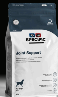
SPECIFIC™ Joint Support CJD